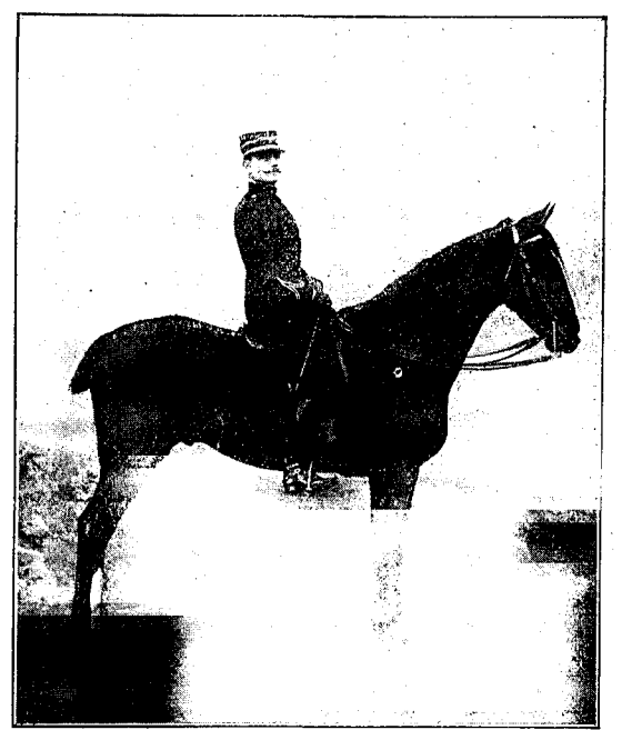
Concours Hippique et Exposition Canine

relé de leur race ? Il est permis d'en douter et cependant toutes les espèces sont là, représentées par leurs plus beaux spécimens. — Voulez-vous des chiens de garde ? En voici de robustes et d'aspect bienveillant avec la pointe de méfiance qui convient. — Etes-vous chasseur ? Vous trouverez de ce côté toutes les variétés possibles, depuis le couple et gracieux setter jusqu'au basset consciencieux et scélère, en passant par le griffon ahuri et le braque versatile.