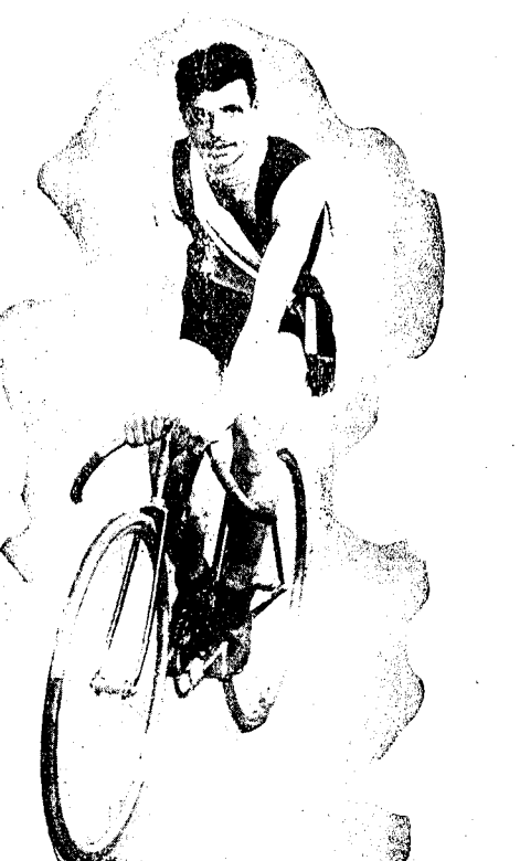
Gliché Ch. Popineau.