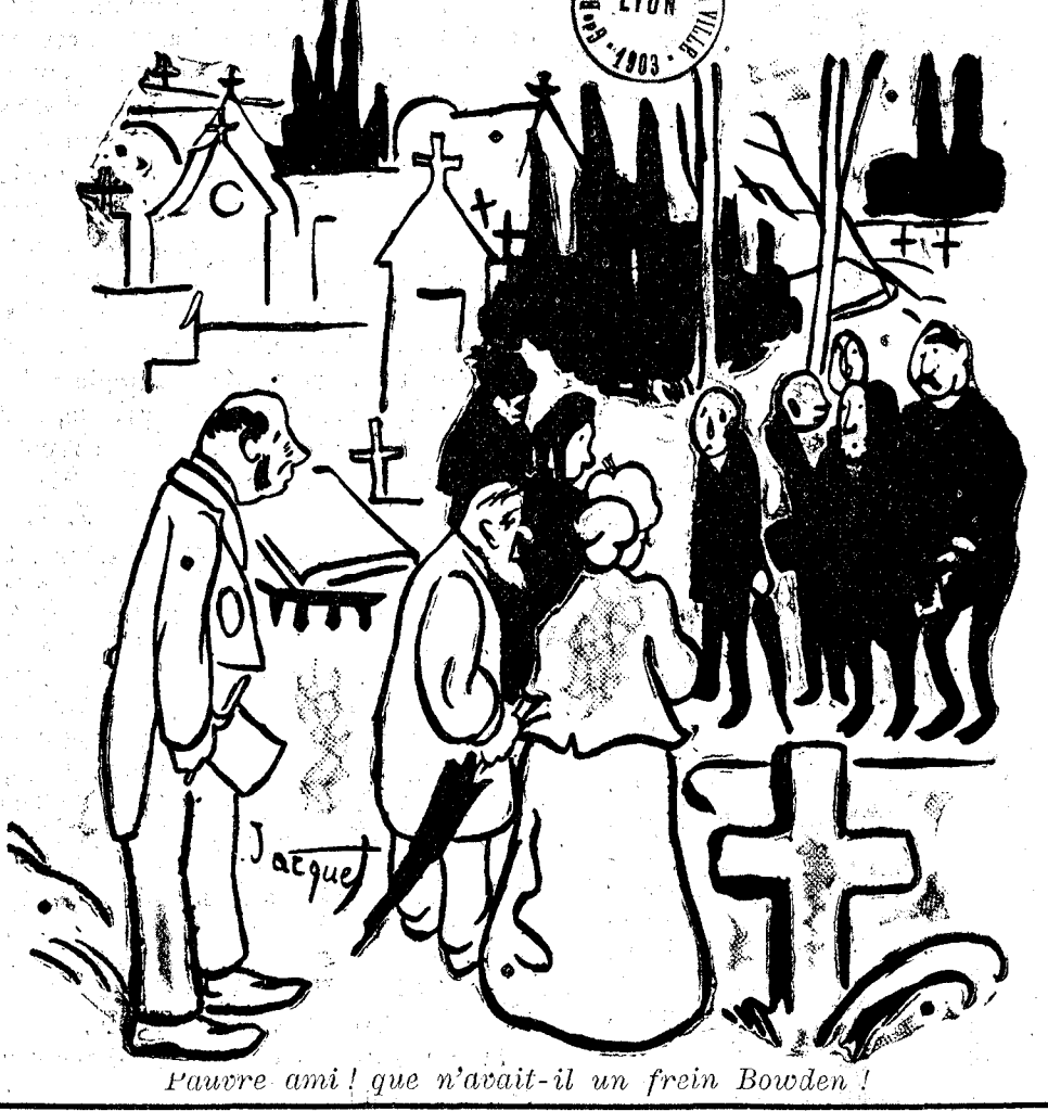
Pauvre ami! que n'avait-il un frein Bowden!