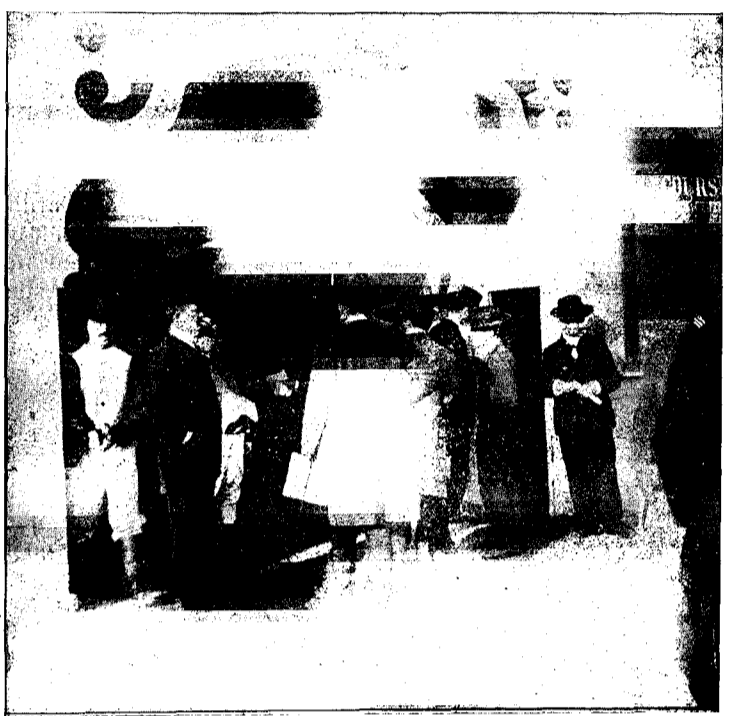
Le Pesage avant la Course.