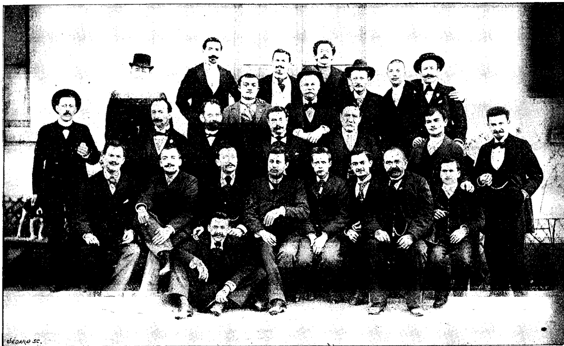
Photographie de Garestia.