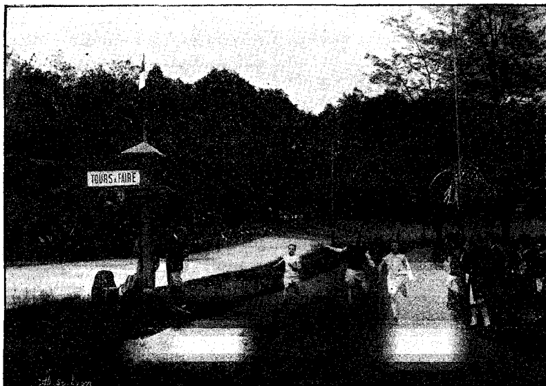
Fête de l'Ecole de Commerce. — L'arrivée du 90 mètres (Prix du Commerce)

Si la lutte à la corde a captivé l'intérêt des spectateurs, elle a été aussi la partie gaie reposant des épreuves sérieuses.