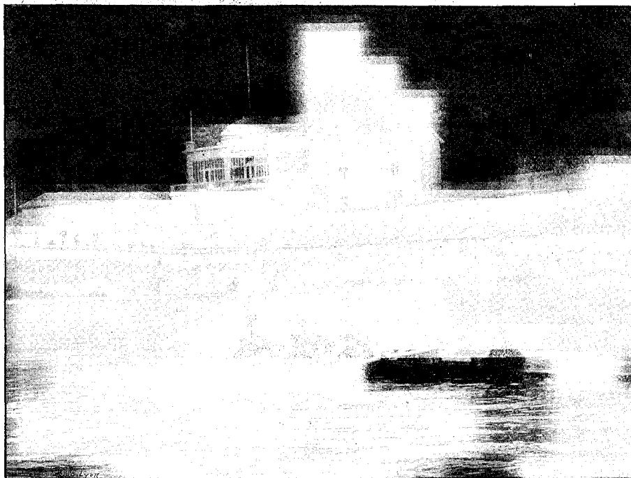
La Faridondaine

L' Union Nautique compte, à ce jour, 145 premiers prix,