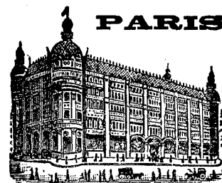
GRANDS MAGASINS DU