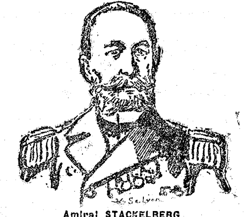
Amiral STACKELBERG Commandant de Port-Arthur

« Le nombre des obus de douze pouces lancés par l'ennemi est évalué à cent cinquante-quatre. Nos navires