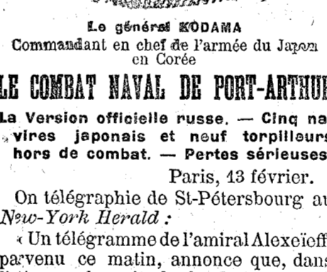
Le général KODAMA, Commandant en chef de l'armée du Japon en Corée

Le bombardement de Hakodate par l'escadre russe de Vladivostok n'est ni confirmé, ni démenti.