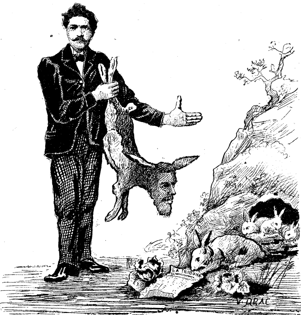
Une première exécution aux abords de la Gare Gare à la deuxième!...

Le « Peuple » est COMPOSÉ et TIRÉ par des Ouvriers syndiqués,