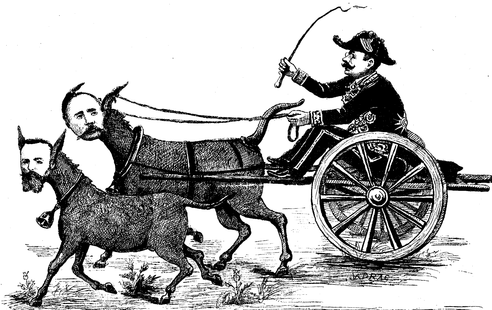
Les engagés :