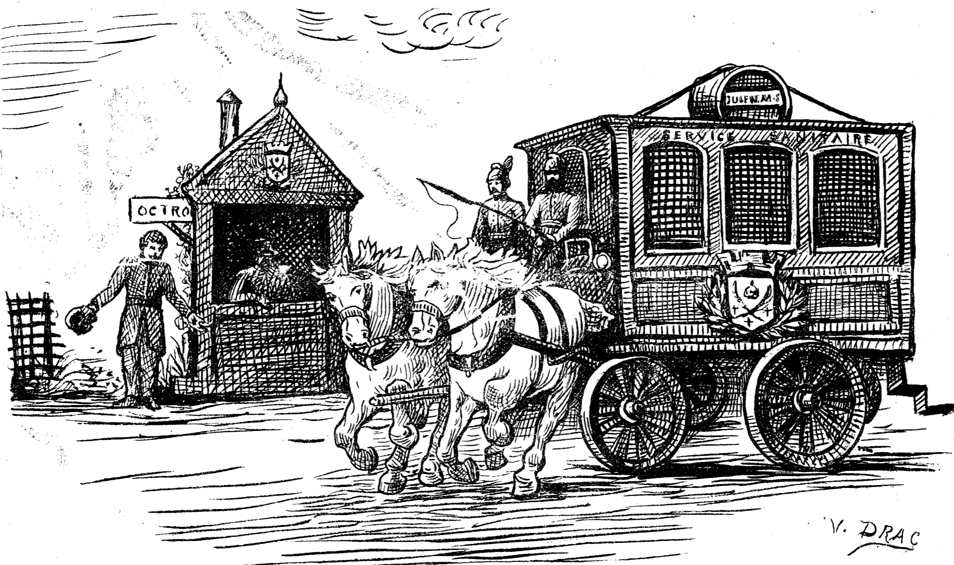
Pour tous renseignements particuliers, s'adresser à la Mairie de Saint-Etienne

Entreprise de Transports rapides et à bon marché Maison lucullus : LEDIN, JULIEN, MOUNIER & C ie