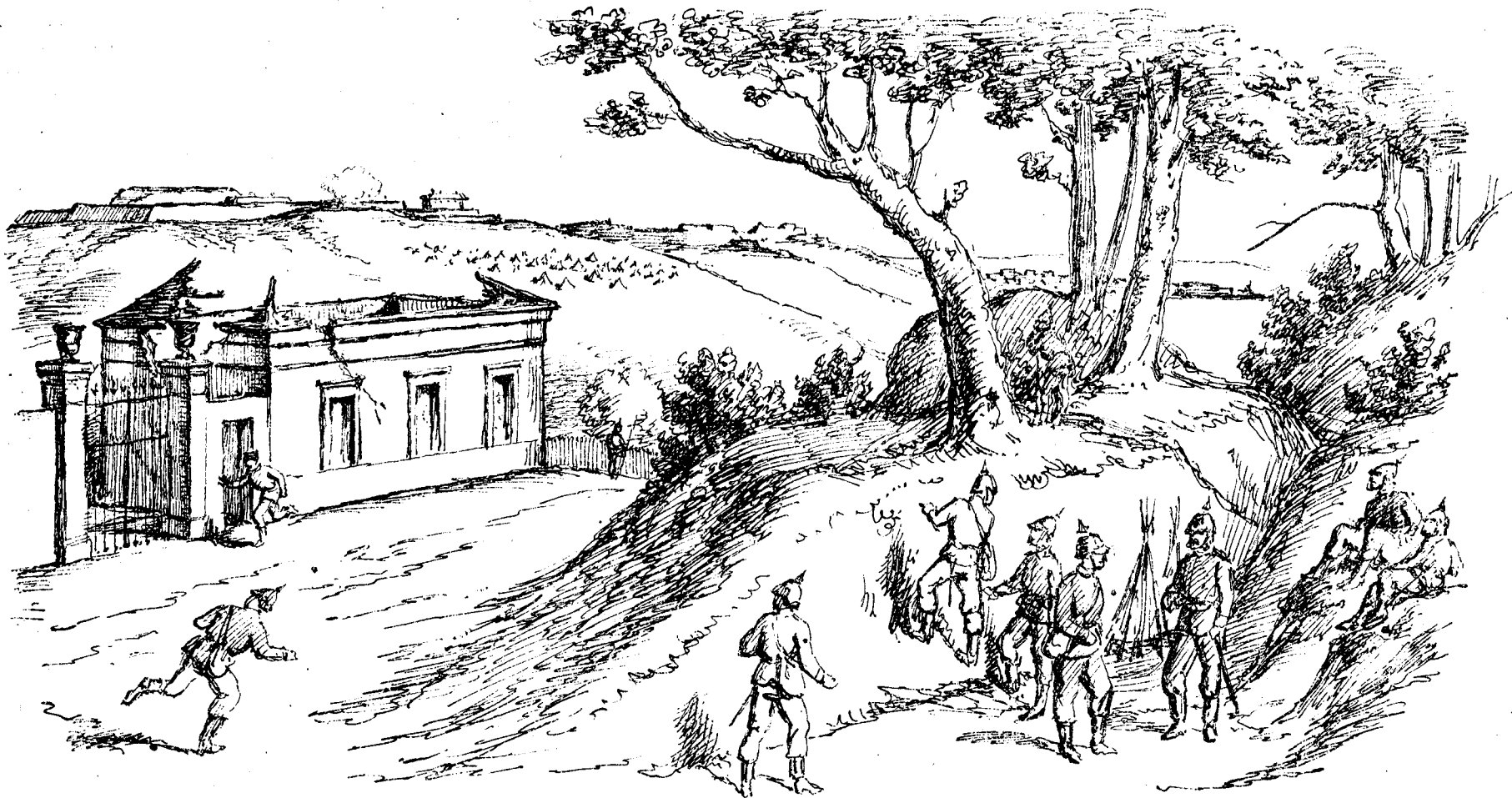
VUE DES FORTS DE NOISY ET DE ROMAINVILLE (prise des lignes ennemies).