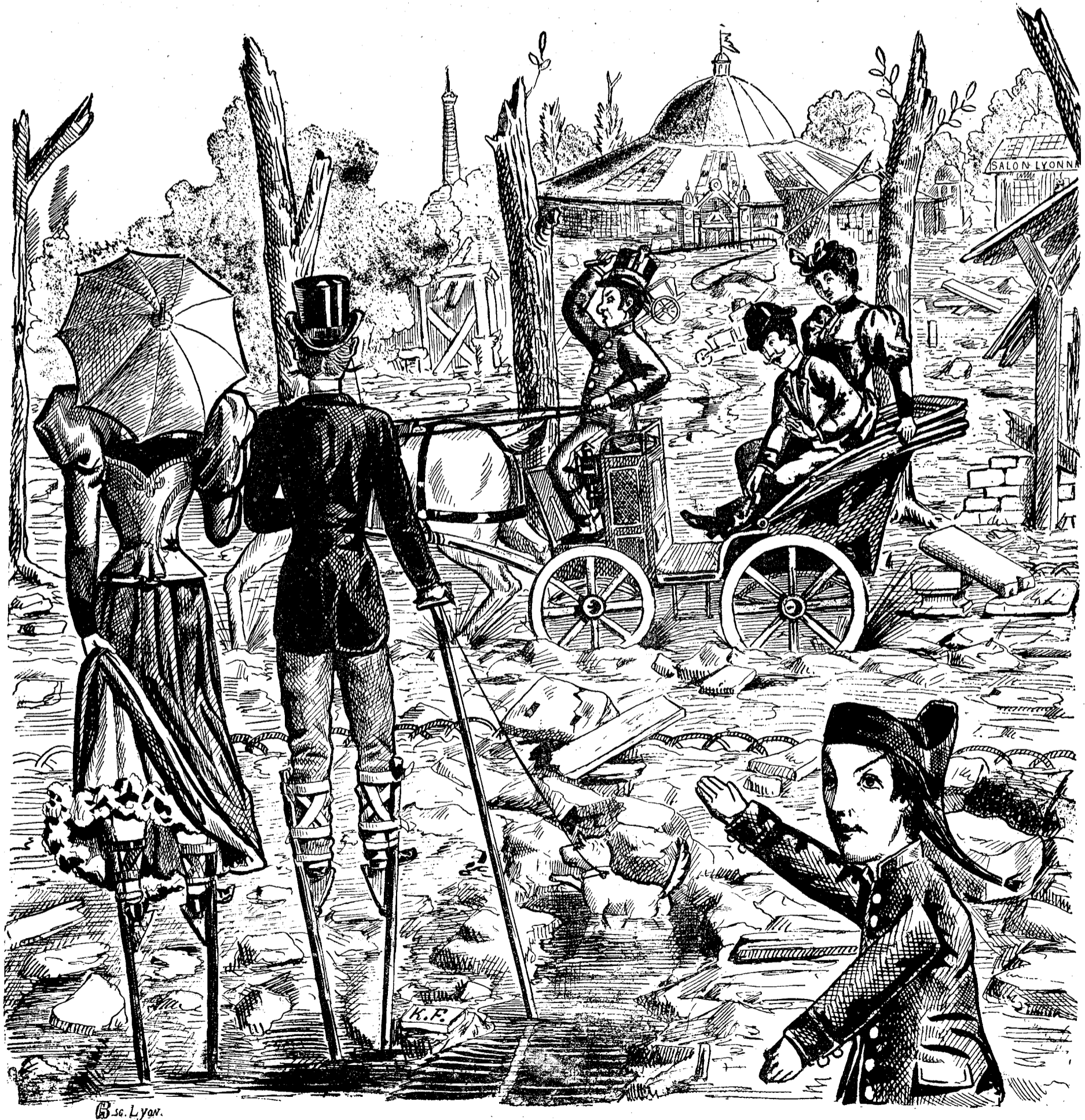
B. se. Lyon.