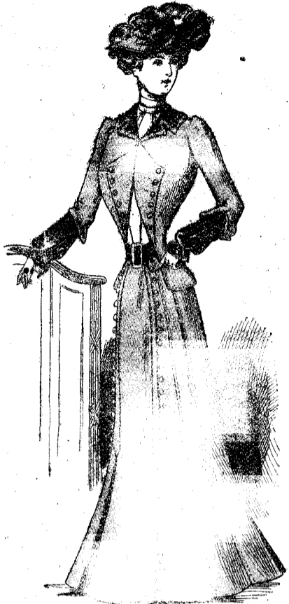
TOILETTE EN DRAP CACHOU GARNI DE BOUTONS DE NACRE.

C'est une toilette en drap cachou, avec veste longue à revers et demi-manches en velours hannelon. Cette veste s'ouvre sur une chemisette blanche en crépon uni. Deux rangées de boutons de nacre blanche garnissent les revers de la veste et la même garniture se répète sur le devant de la jupe.