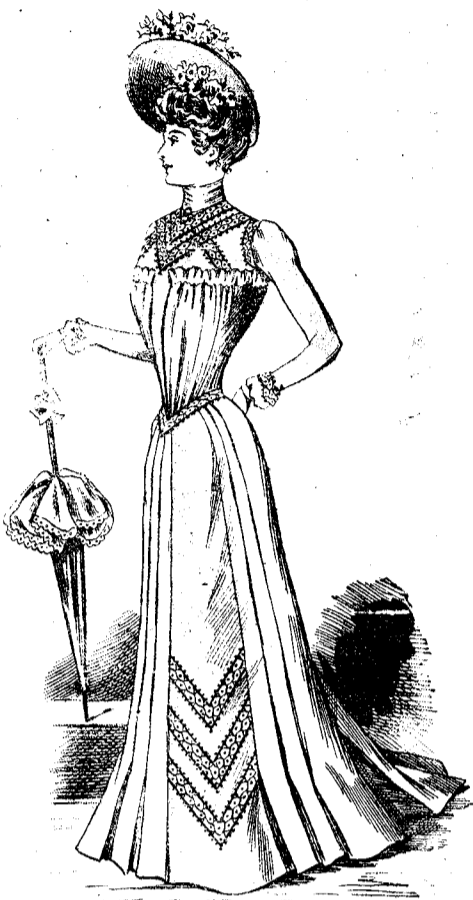
COSTUME NOUVEAUTÉ EN LINON MAUVE

Presque toujours les jupes se plissent sur le côté, à plis cousus ou à plis plats, le devant formant tablier, et plis Watteau, derrière. Les corsages sont froncés, plissés à plis lingerie, ou à plis plats, presque toujours décolletés, sur empiècement de guipure crème ou rousse, sur transparent de taffetas blanc.