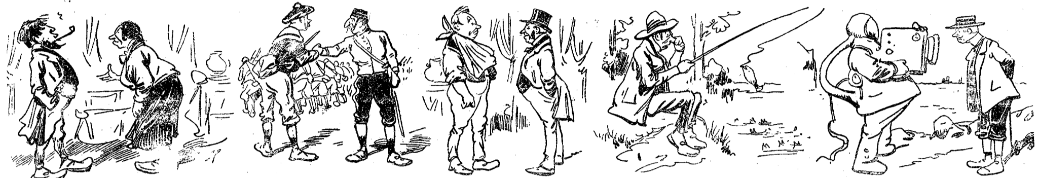
— Tu es toujours le même... tu cherches précisément pour vouloir prendre un bain de pied les années où on n'a plus d'eau ! Touchant accord des puissances en Chine L'Anglais : Yes... vous marchez d'abord sur Pékin... moi, je vous rattrape... je reste un peu en arrière pour surveiller le Russe. — Un moyen d'avoir de l'eau à Paris... eh sacrébleu ! que les méridionaux nous envoient leurs rivières et leur eau... on prétend qu'ils ne s'en servent jamais ! Rives de la Seine. Les poissons se précipitent avec joie sur le hameçon, préférant une mort rapide à la lente asphyxie dans les eaux empoisonnées du fleuve. — Descendez-vous avec moi ? — Où ça ? — Au fond de la mer ; je vais photographier un sous-marin.