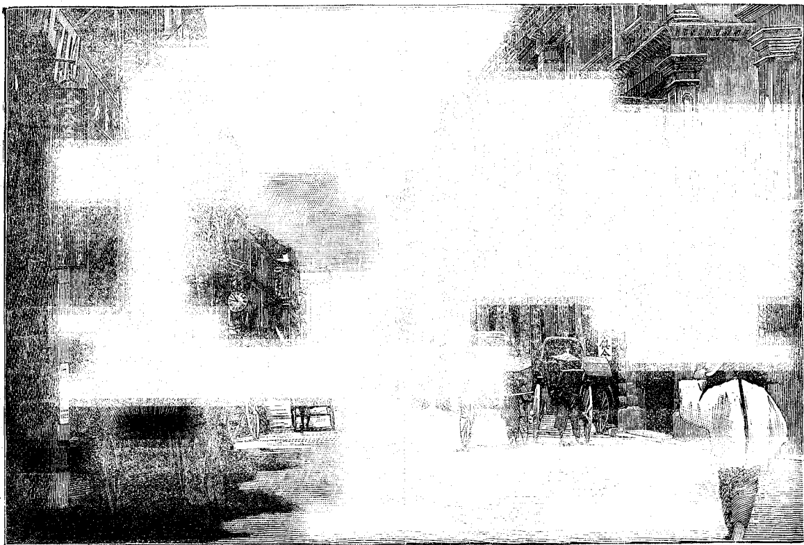
Une Rue à Hong-Kong.

Le monde entier suit avec une attention angoissée les sanglants événements qui se déroulent en Chine et dont il est, à l'heure actuelle, bien difficile d'entrevoir les conséquences. Rien de plus inconnu, en Europe, que la vie de ces centaines de millions d'hommes qui peuplent l'immense