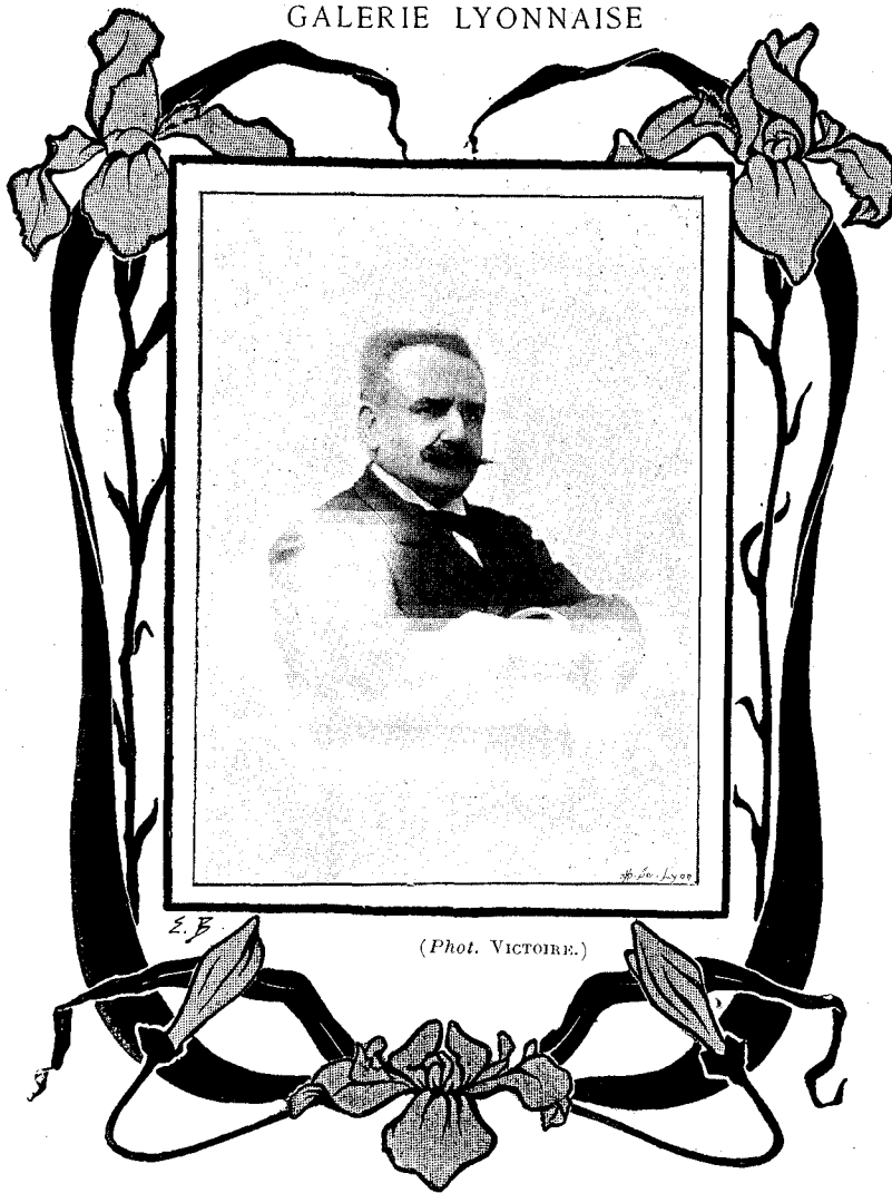
M. RÉPIQUET Sénateur du Rhône.

sincère j'aurai toujours pour ton culte, alors même que je cesserais d'être l'objet favori de ta prédilection. Amen ! »