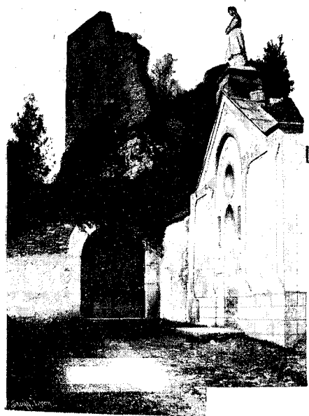
Crémieu. — La Chapelle de la Salette.

dans un autre creux en cuvette. Un peu plus loin est le Creux-des-Morts , cimetière dont les nombreuses tombes très primitives ont