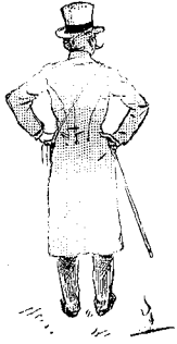
Vient pour voir... et être vu.