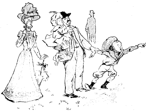
SUR LA PELOUSE, OU LES TRIBULATIONS D'UN PÈRE DE FAMILLE