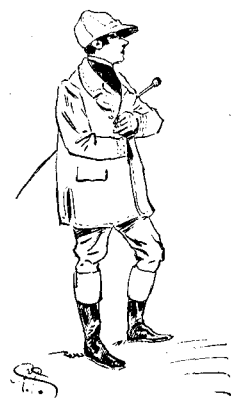
LE FAVORI DU PARI MUTUEL