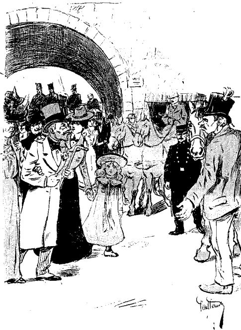
SORTIE DES COURSES