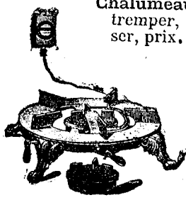
Réchaud No 4.

Potager à 3 réchauds et 1 grilloir (fourneau) à feu dessus et dessous, 0m65/0m30, prix. 50 fr. Calorifère s'adaptant au réchaud n°4, prix 17 » Chalumeau pour forger tremper, souder, braiser, prix..... 18 »