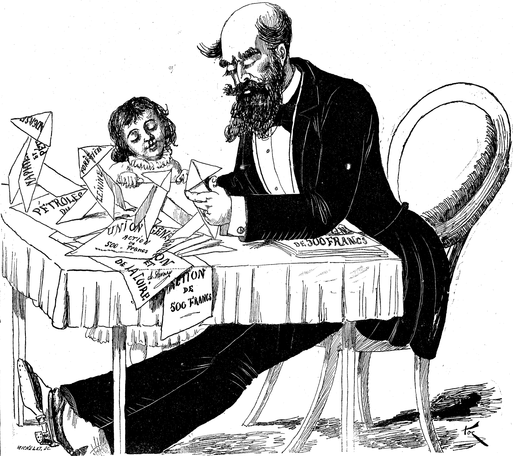
CONSOLATIONS D'UN DÉCAVÉ