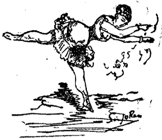
CI-DEVANT GRAND-THÉÂTRE DE LYON.