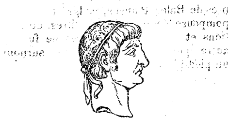
MARC-ANTOINE, le triumvir.

certain exemplaires de cette pièce on lit du côté du lion ANTONI IMP. et de l'autre III VIR RPC, que l'on doit lire Antonius imperator triumvir Reipublicæ constituendæ , c'est-à-dire : Antoine empereur l'un des trois (établis) pour constituer la République. Les autres types, précieux pour l'histoire lyonnaise, portent au lieu de Antonius imperator , le mot LVGVNVI ce qui veut dire : (frappé) à Lugudunum. On lit en outre sur certaines de ces monnaies A. XL. et sur les autres A. XLI, abréviations dont l'interprétation a divisé les savants, mais qui, suivant l'opinion la plus autorisée, indiqueraient l'âge de Marc-Antoine à l'époque où ces pièces furent frappées.