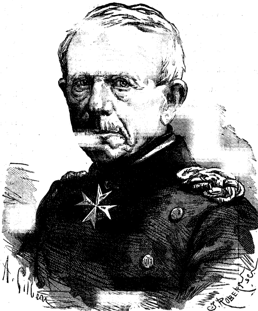
LE GÉNÉRAL DE MOLTKE

Ces notes émanées d'un artilleur, victime comme le corps tout entier de l'artillerie de combat, de commissions et de directions, seules à se reconnaître un savoir dont la France entière victime elle-même, peut aujourd'hui, après les faits de cette déplorable guerre, apprécier la valeur, méritent d'attirer l'attention immédiate du gouvernement.