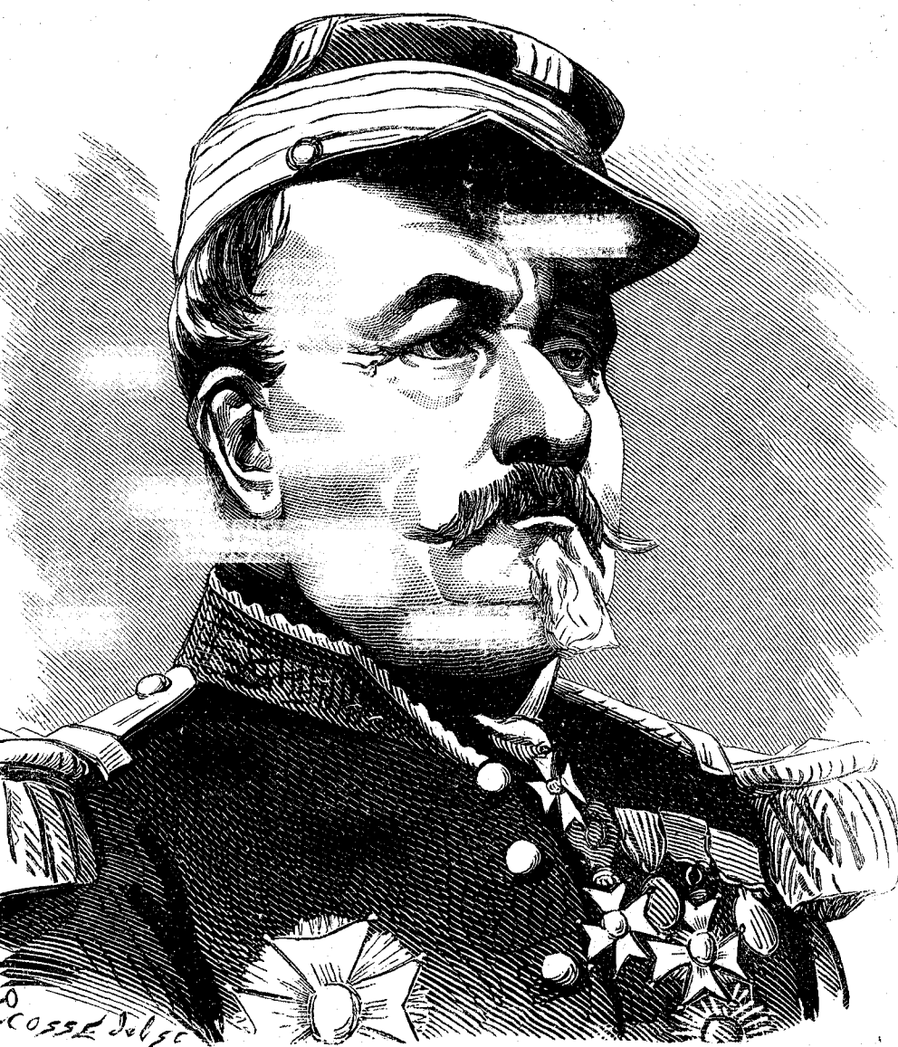
LE GÉNÉRAL UHRICH L'HÉROÏQUE DÉFENSEUR DE STRASBOURG

Les Prussiens sont sous les murs de Paris !