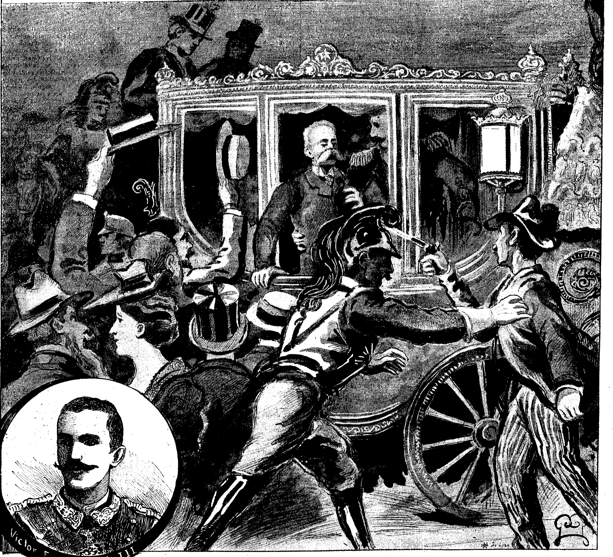
L'ASSASSINAT DU ROI D'ITALIE, A MONZA