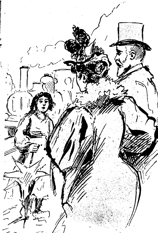
Une des Petites Filles Survivantes