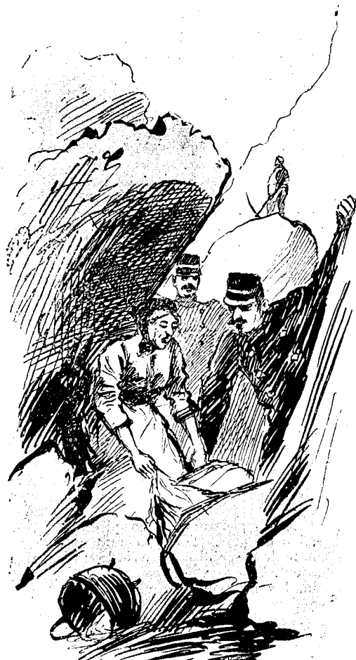
La femme du Garde barrière

sont reçues directement aux Bureaux du Journal ET DANS TOUTES LES AGENCES DE PUBLICITÉ De France et de l'Etranger