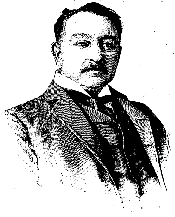
Sir Cecil RHODES

PRÉSIDENT DE LA RÉPUBLIQUE TRANSVAALIENNE