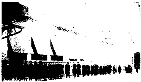
Stores Baumann à l'École de Virmes (S.-et-O)

CONCESSIONNAIRE POUR LE RHONE ISÈRE, LOIRE, SAONE ET LOIRE, AIN, COTE D'OR Catalogues — Études — Devis